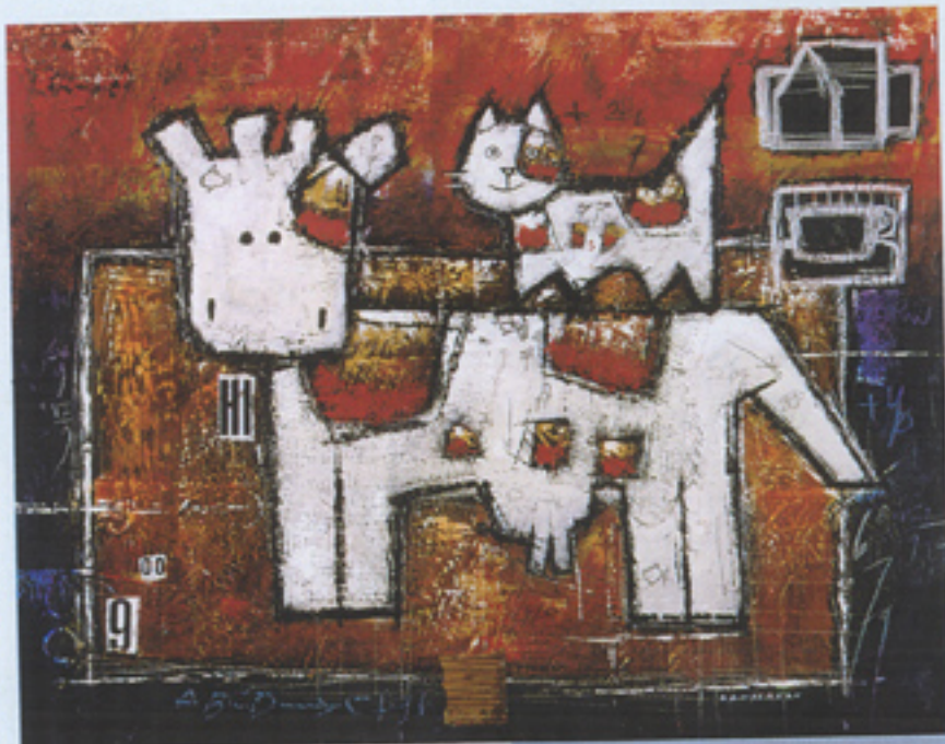
Gérard Dansereau, Soleil levant pour nos amis , technique mixte, 61 x 76 cm

It is a little bit as if I were writing a mystery novel". "This makes us want to see your new paintings. What is up next for you?" "There is a documentary being produced on my work, but this project may take quite some time to be completed. I am nevertheless awaiting it with much enthusiasm". ●